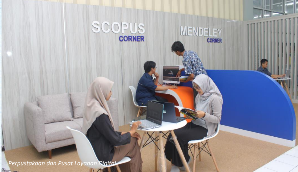
Perpustakaan dan Pusat Layanan Digital